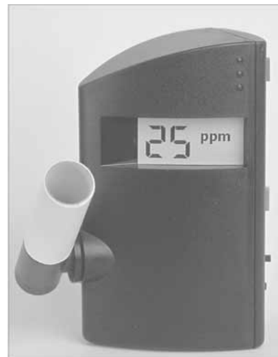
Abbildung 1: Testgerät für H 2 -Atemtest

Eine weitere wichtige Differentialdiagnose stellt die Histaminunverträglichkeit dar. Klinisch treten Beschwerden auf, die auf eine vermehrte Histaminwirkung zurückzuführen sind: Histamin Kopfschmerz (Migräne), Flush (Erröten, besonders nach Alkoholgenuß, vor allem nach